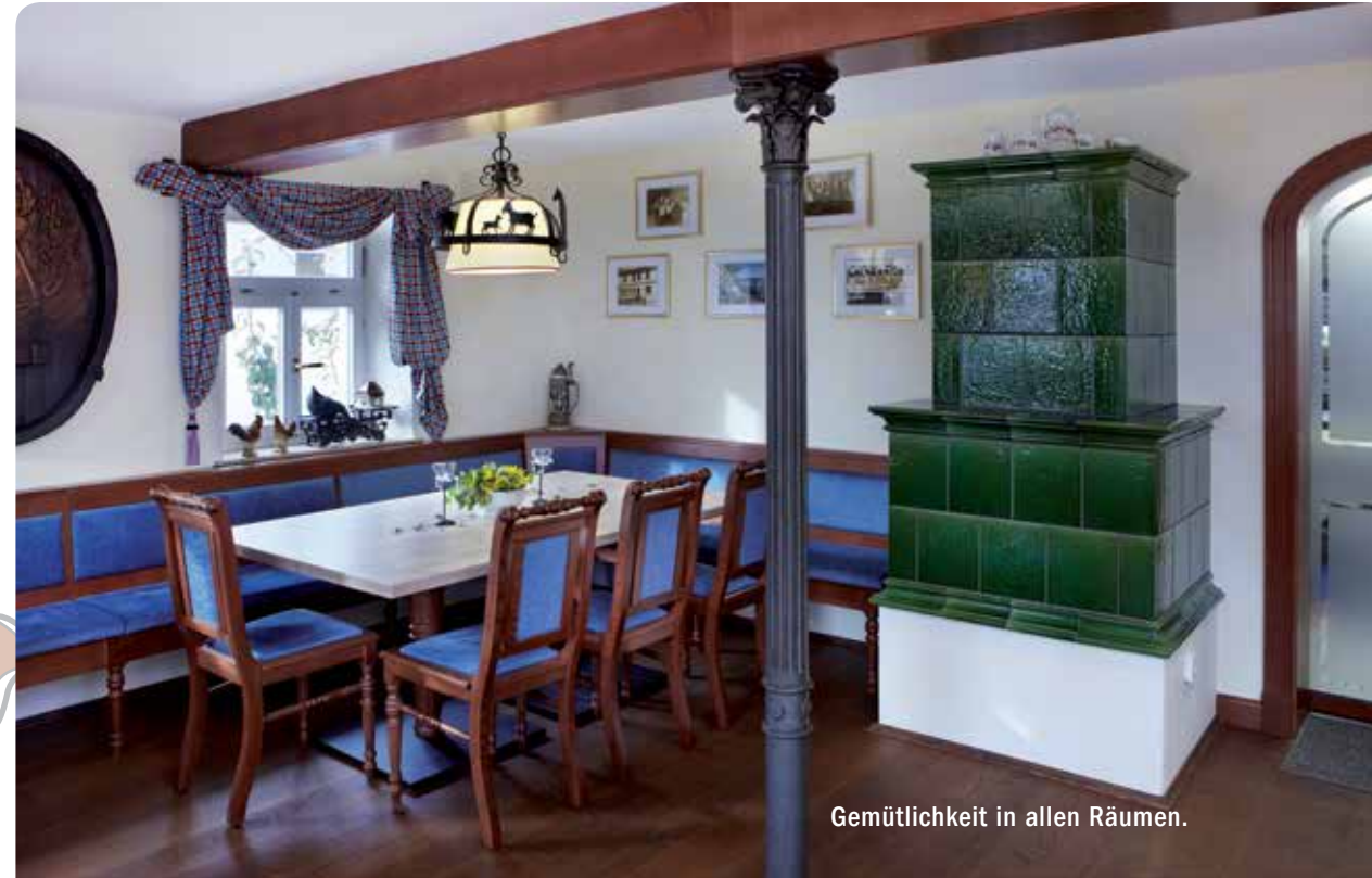
Gemütlichkeit in allen Räumen.

Schließen Sie Freundschaft mit netten Menschen!