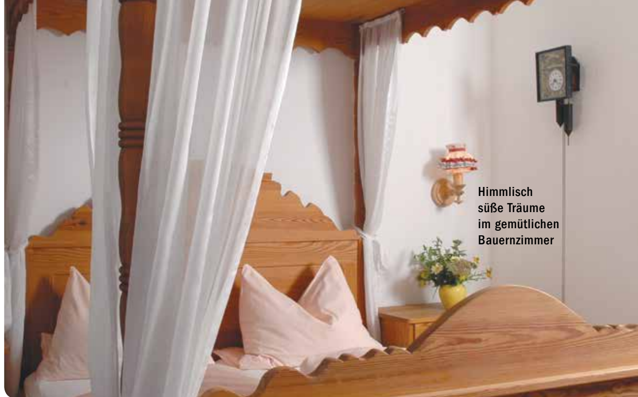
Himmlisch süße Träume im gemütlichen Bauernzimmer

Schlafen Sie wohl und träumen Sie schön!